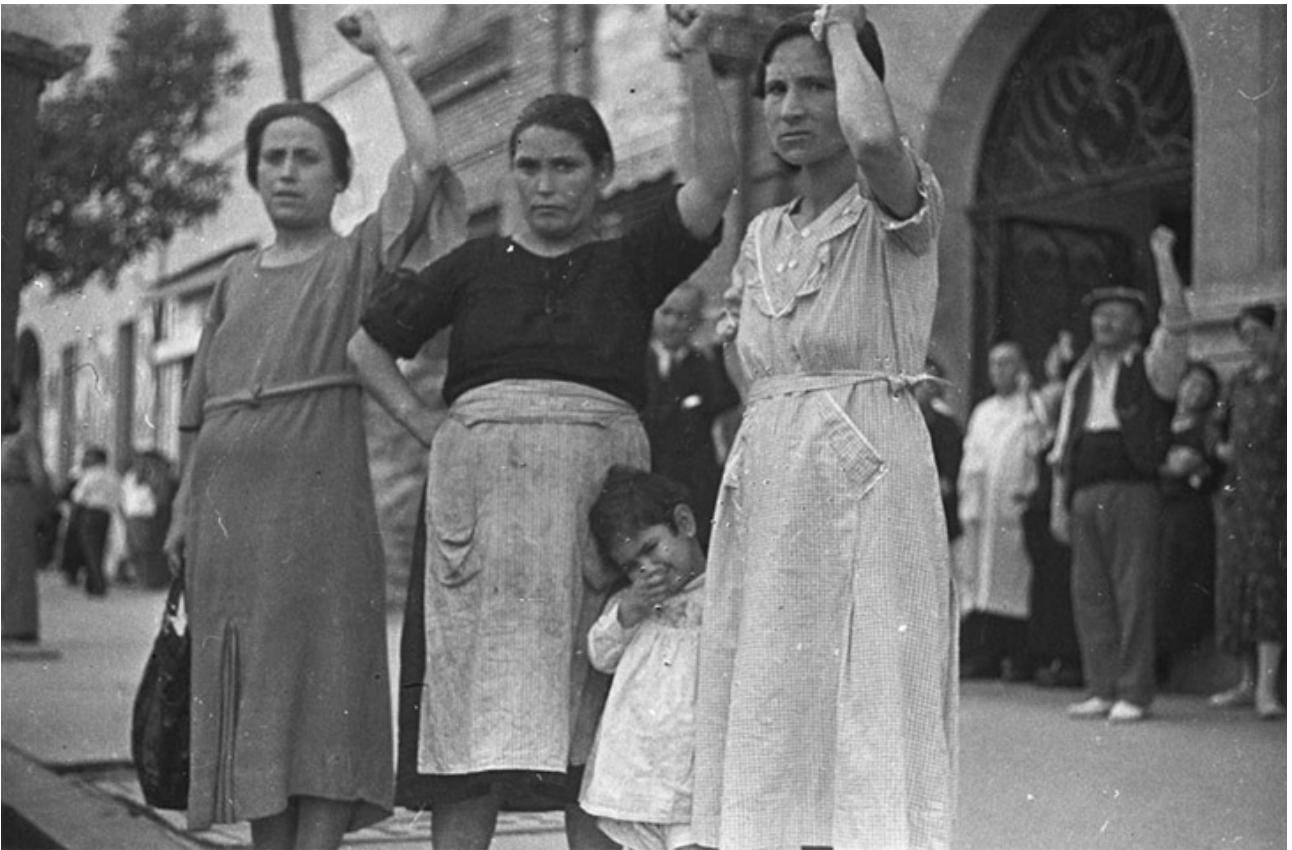
Gerda Taro. Mujeres durante el cortejo fúnebre del general Lukács. Valencia, 12 de junio de 1937.